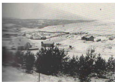
Areál manganorudných baní v Kišovciach

Mangánová ruda ako strategická surovina pre výrobu ocelí začala byť vyhľadávaná v druhej polovici 19. storočia, v období industriálnej revolúcie v Uhorsku. V roku 1939 sa zvýšila ťažba mangánovej rudy, čo malo za následok príliv prisťahovalcov za prácou nielen z rôznych častí Slovenska, ale aj Maďarska, Poľska i Rumunska. Na začiatku 20. storočia sa vyčerpala povrchovo dobývateľná časť ložísk a prešlo sa na otváranie hlbinných častí. To si vyžadovalo investičné prostriedky a modernejšie technické vybavenie bane. Vítkovické banské a hutné ťažiarstvo Koterbachy vystavali bankský závod s bytovou kolóniou a lanovkou ku železnici v Kišovciach. Banská a hutná spoločnosť zasa postavila vlastný závod vo Švábovciach. V roku 1941 – 1945 bane získala Ruda, uč. spol. Koterbachy. V roku 1945 bola tunajšia baňa znárodnená a stala sa závodom Železorudných baní Spišská Nová Ves. Ťažba bola ukončená 1. apríla 1971 z ekonomických dôvodov.