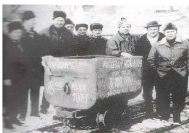
Posledný vagón s rudou vyvezený z bane