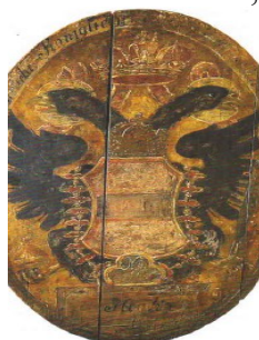
Vývesný štít pošty v Hôrke